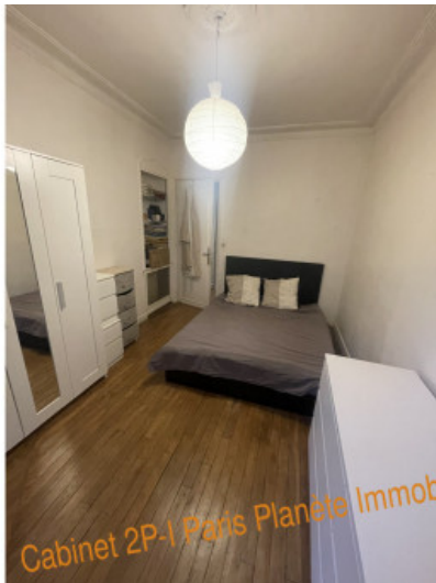
Cabinet 2P-1 Paris Planète Immobilier