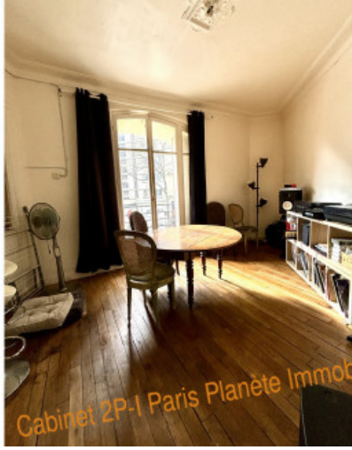
Cabinet 2P-1 Paris Planète Immobilier