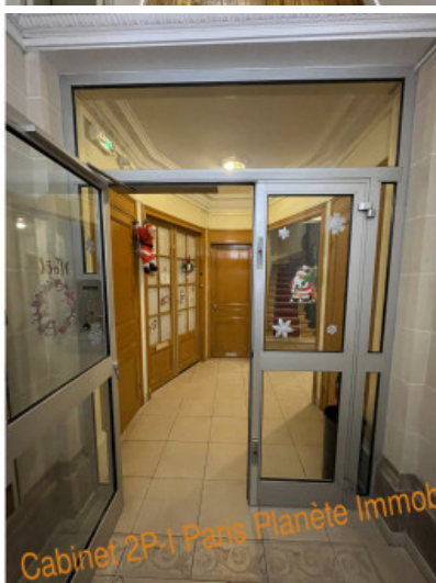
Cabinet 2P-1 Paris Planète Immobilier