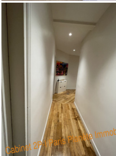
Cabinet 2P-1 Paris Planète Immobilier