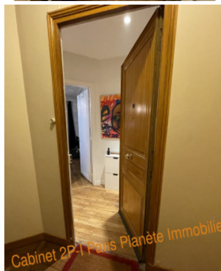
Cabinet 2P-1 Paris Planète Immobilier