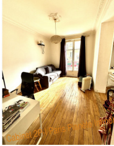
Cabinet 2P-1 Paris Planète Immobilier