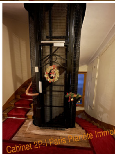
Cabinet 2P-1 Paris Planète Immobilier