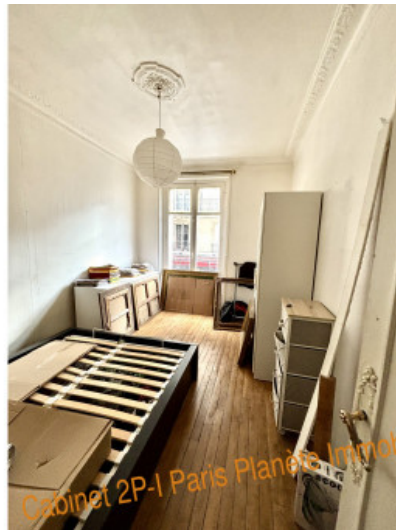
Cabinet 2P-1 Paris Planète Immobilier